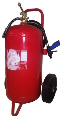
PERFEX 50 EPA

Class A fires involving solids Class B fires involving liquids